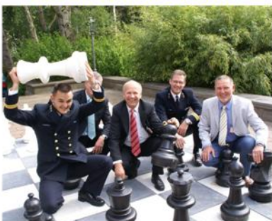
a team with the right knowledge, skills and attitude

Asset Management Control is gedefinieerd als kennisgebied én aanpak, voor het op een gestructureerde wijze implementeren en daar waar mogelijk verbeteren, van Asset Management. Hierbij staat 'Control' voor het beheersen van Asset Management en daarmee alle onderliggende processen. Dit met als hoger gelegen doel 'het voorzien in de vereiste asset-/systeemfunctionaliteit tegen minimale kosten'.