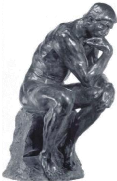
It's not simple and takes some time

De systeemaanpak van AMC helpt daarbij door op een systematische wijze de assets, processen en betrokken actoren inzichtelijk te maken m.b.v. systeemmodellen en het initiëren van Life Cycle Management Teams.